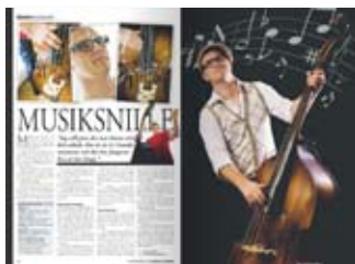
Reportage, nr 9 2008.