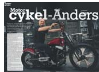
Reportage, nr 6 2009.