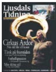
Omslag, nr 4 2008.

(Urval av sidor i Ljusdals Tidning 2007-2009.)