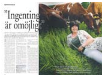
Reportage, nr 3 2007.